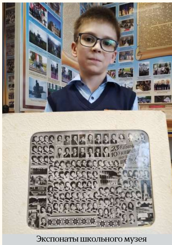
Экспонаты школьного музея

Мы с одноклассниками стараемся чаще собираться вместе, хоть многие и разъехались. Поддерживаем связь, и я являюсь главным организатором наших встреч. Прекрасно отпраздновали 10 лет выпуска, а впереди пятнадцатилетие.