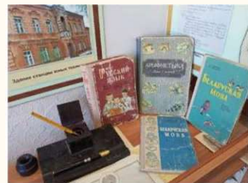
Экспонаты школьного музея