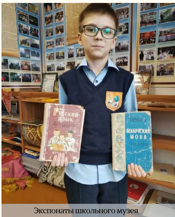
Экспонаты школьного музея