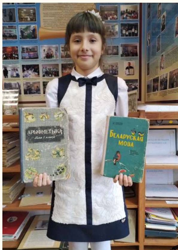
Экспонаты школьного музея