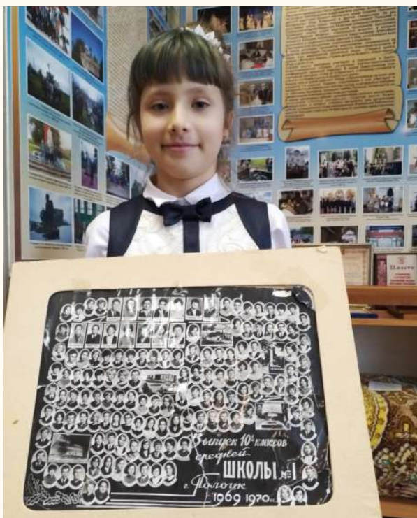
Экспонаты школьного музея