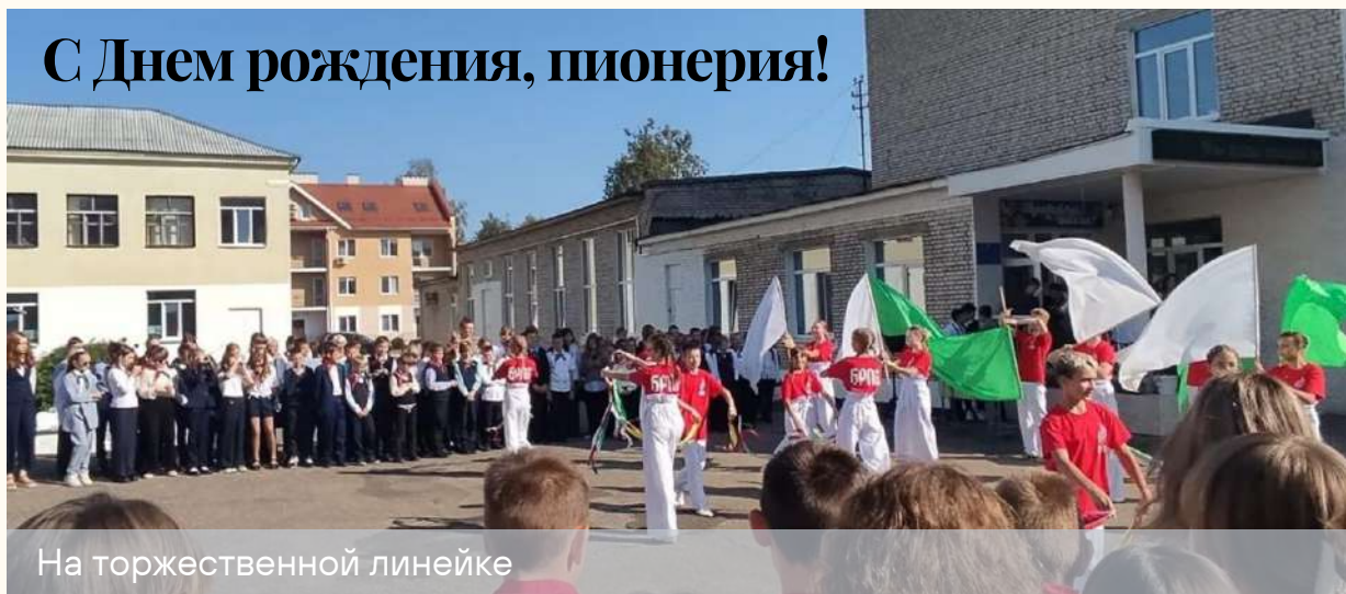
На торжественной линейке

13 сентября Белорусская пионерская организация отметила свой День рождения. Пионер - значит первый! Он в жизни действительно стремится быть первым и лучшим в конкурсах и мероприятиях, в учёбе и труде.