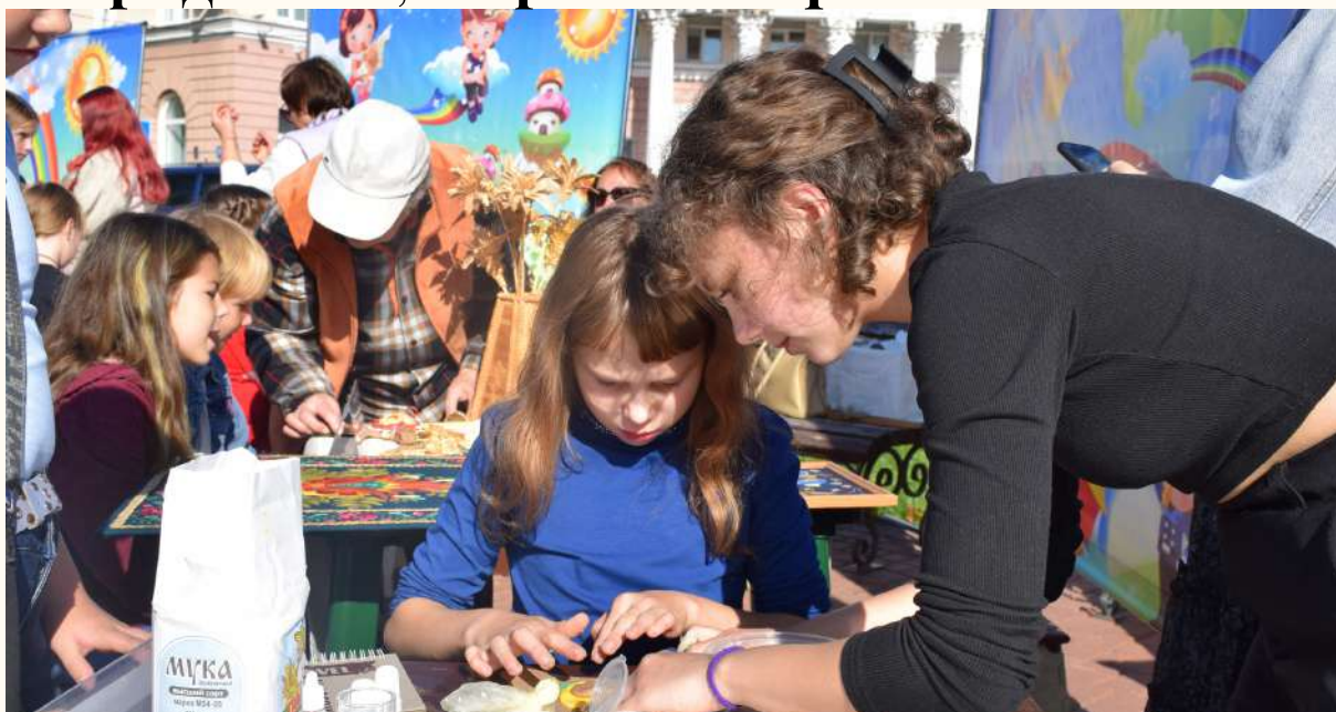
На интерактивных площадках фестиваля

Привет, друзья! Спешим вам рассказать о невероятном путешествии, которое произошло с нами. В один из субботних дней сентября на площади Франциска Скорины прошел фестиваль «Мир детства, творчества и фантазии», на котором мы и побывали. Цель мероприятия - помочь школьникам города выбрать себе занятие по душе.