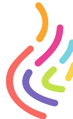
Полноцветная версия. Основная версия эмблемы. Используется для полноцветной печати

Одноцветная версия используется в тех случаях, когда полноцветная печать невозможна.